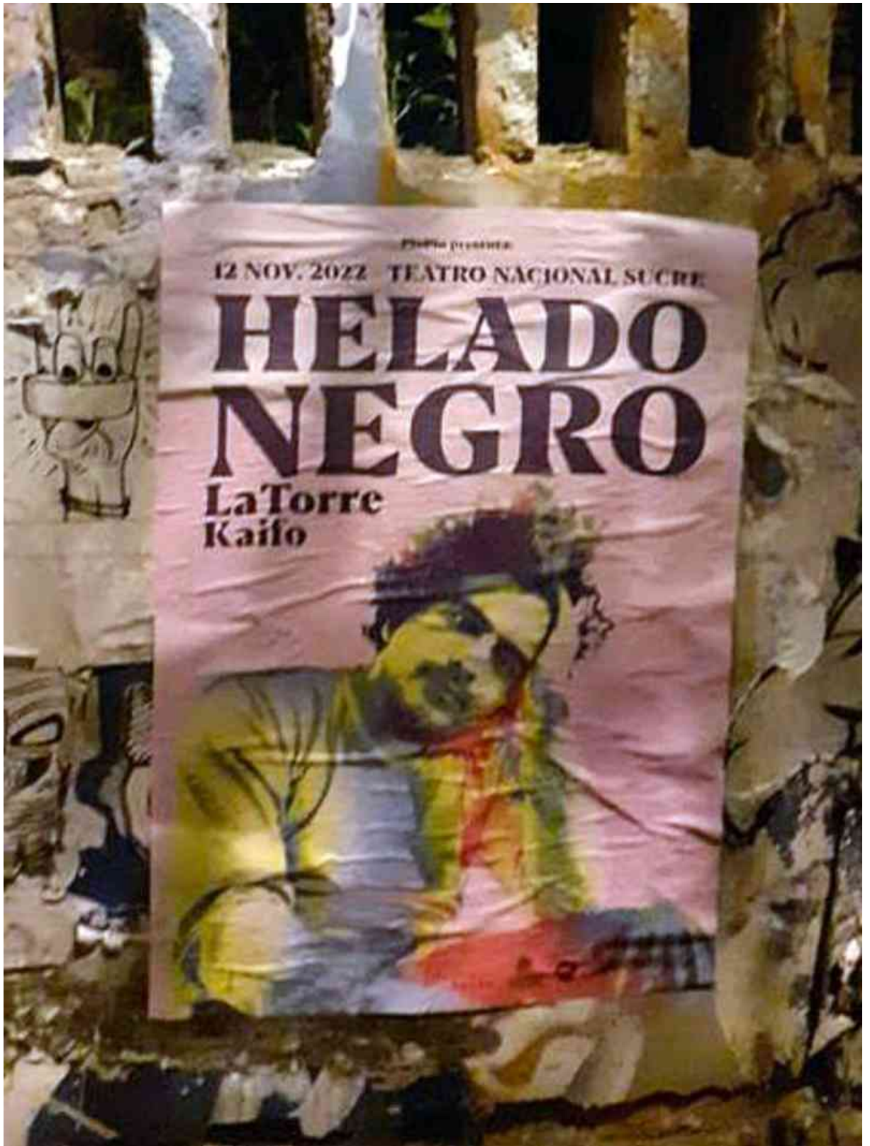
Helado Negro: concierto en Quito hace dos meses.

Entonces la pregunta sería, ¿qué hacer para sincerar el espíritu original del poster y la producción que se exhibe en el circuito de festivales y bienales? ¿Sería necesario acercar los lenguajes al gran público, o ese factor cambiaría solo una vez que se cambien los requisitos para inscribir una pieza? ¿Se debería insistir con los nombres afiche, poster o cartel, o habría que encontrar algo más certero, relativo a la calidad interactiva y efímera de un posteo gráfico