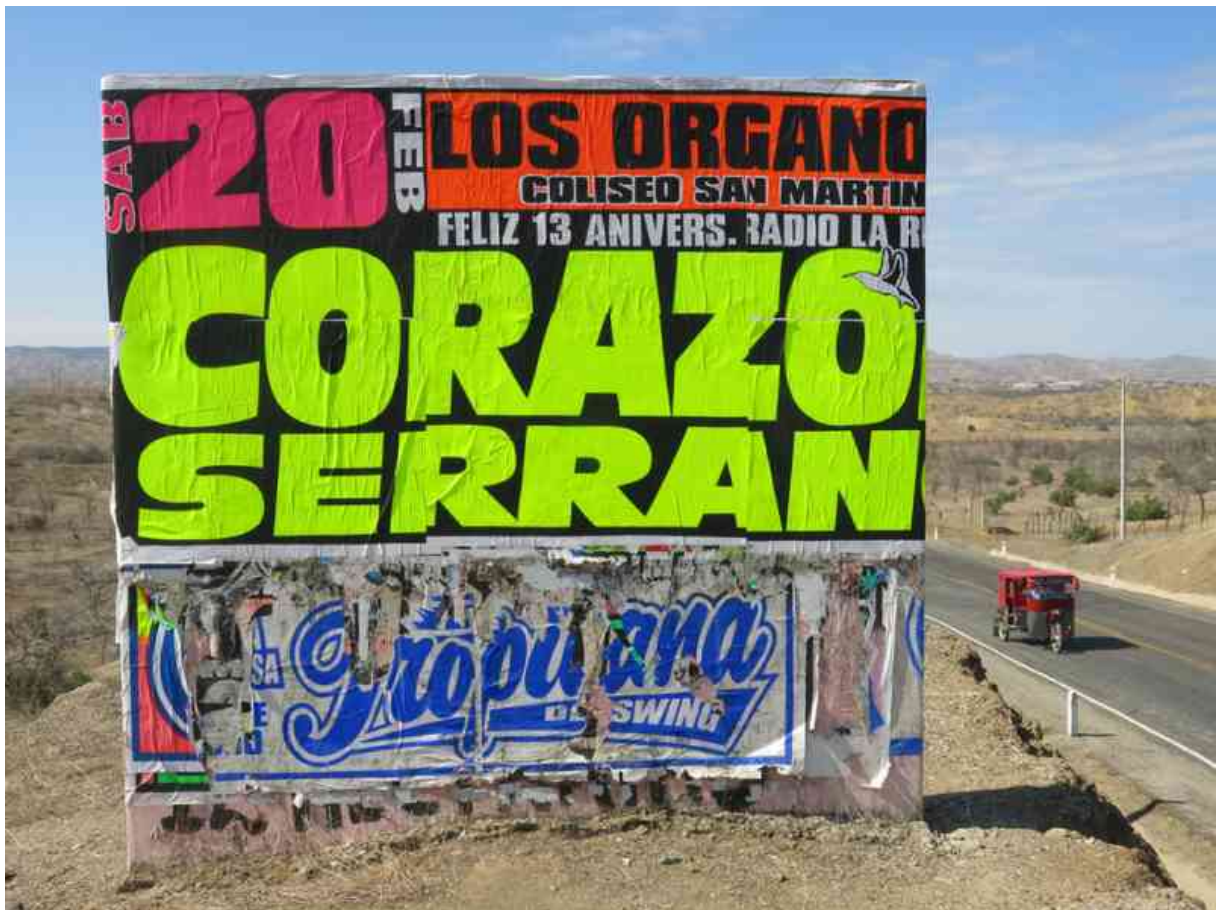
Corazón Guerrero: carteles tipográficos para la promoción de conciertos populares en Perú, Ecuador y Colombia.

Hay un paralelismo con la fotografía, que antes requería, aparte de una sensibilidad especial, un know how técnico y un medio de comunicación muy específico para poder llegar al gran público. Hoy, con un teléfono y las RRSS, las posibilidades crecieron brutalmente. Cualquiera puede hacer una foto que se vuelve viral en cuestión de horas, con millones de reproducciones, y que pasará al olvido en menos de un par de días. Pero pongo en duda que tengan éxito o lleguen a publicarse unos libros del estilo «Lo mejor de la fotografía en Instagram de 2022».