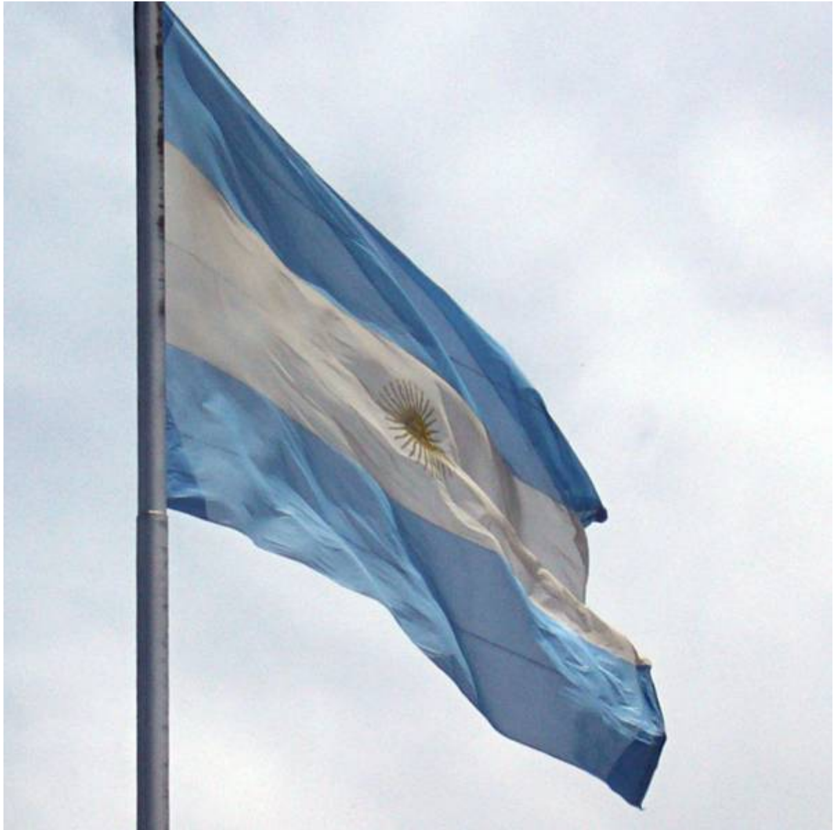
A bandeira argentina

Manuel Belgrano desenhou símbolos conhecidos em todo o planeta e promoveu a formação de artistas visuais. Além de ser um herói da pátria Argentina, Belgrano também merece ser escolhido como patrono do design na América Latina.