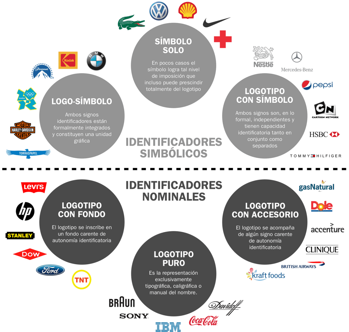
Esquema de megatipos de marcas gráficas (Cassisi, Belluccia, Chaves).

explorado: «los tipos marcarios». Todos los días se diseñan y re-diseñan en el mundo gran cantidad de marcas gráficas, lo cual amerita el que exista una mínima conceptualización, que ayude a la efectividad del trabajo de quienes dirigen programas marcarios y quienes diseñan marcas gráficas. 1 Recordemos la clasificación propuesta: