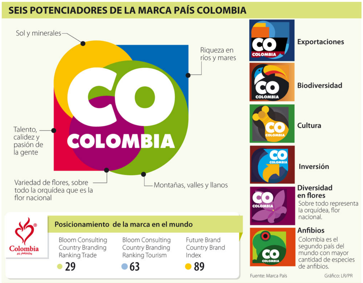
Gráfico extraído del diario La República. Explicaciones varias de conceptos de la marca.

Siguiendo con la variedad de sentidos que se le dan a los colores, veamos la comparación particular de cada uno de los colores compartidos por las dos marcas: