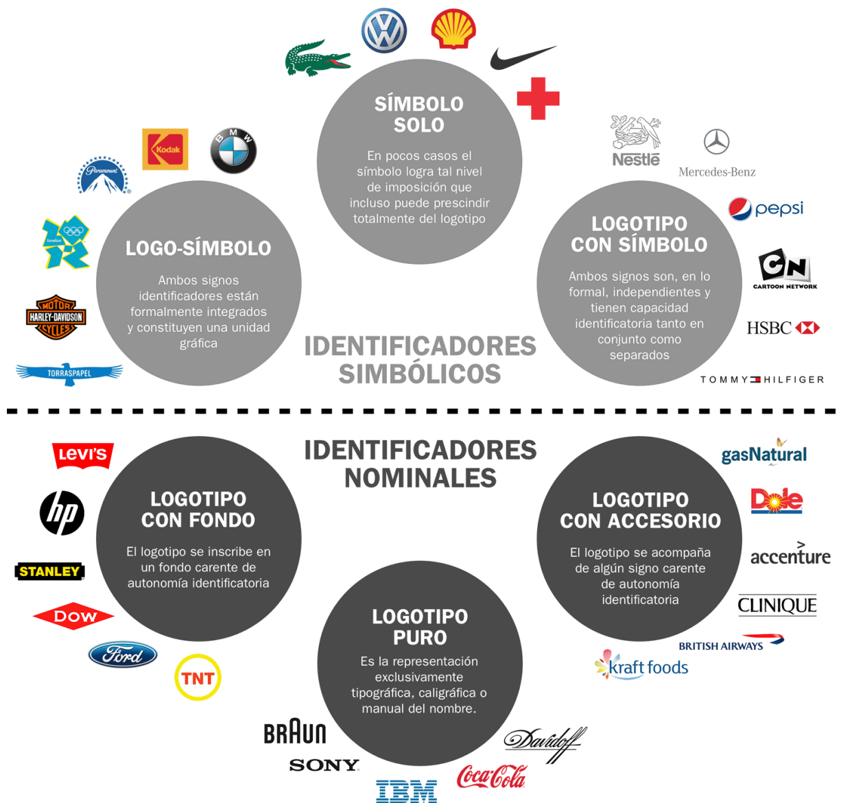
Esquema de mega-tipos de marcas gráficas (Cassisi, Belluccia, Chaves).

En cada uno de estos «megatipos» se despliega una tipología interna que aporta matices, permitiendo segundas selecciones que van definiendo la marca con mayor precisión y mayor ajuste al caso. Y, obviamente, entre estos megatipos podemos localizar tipos híbridos cuyas identidades genéricas, por así decirlo, «titilan» conforme la mirada priorice unos u otros rasgos. Un «logotipo-con-fondo», según sean las características de ese fondo, puede acercarse al «logo-símbolo» y un «logotipo-con-accesorio», según sean las características de ese accesorio y su forma de uso, puede acercarse al tipo «logotipo-con-símbolo».