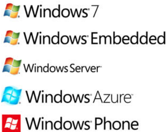
Arquitectura marcaría actual de los productos Windows

¿Servirá el la «ventana en perspectiva» para construir la futura arquitectura marcaría de los productos Windows? Recordemos la actual arquitectura marcaría.